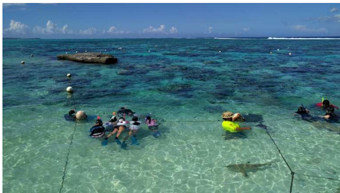
** 手前にサメがいるのが見えますか？