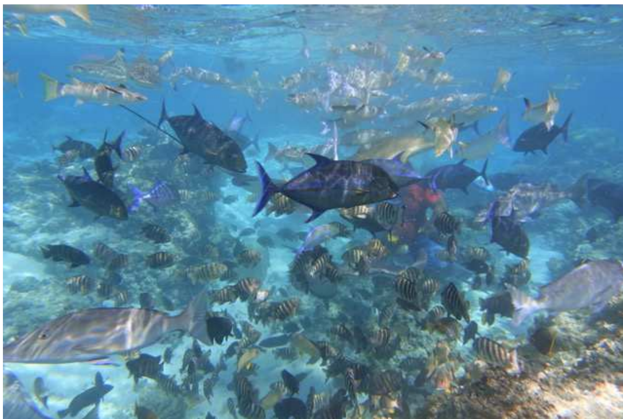
魚の群れ！ここにもロープが張ってあり、まずはロープに掴まってガイドさんが餌付けをするのを見ます。餌を狙って、サメやエイはもちろん、色とりどりの魚たちが集まってきます。モーレア島でもボラボラ島でも、これほど多くの魚を