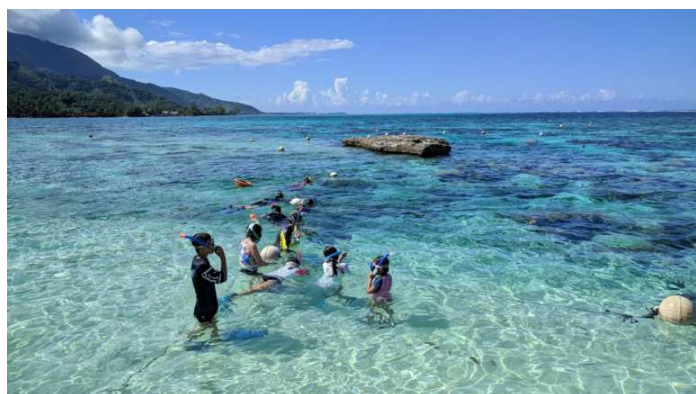
大きな岩の向こうに移動すると、こんな感じでした。