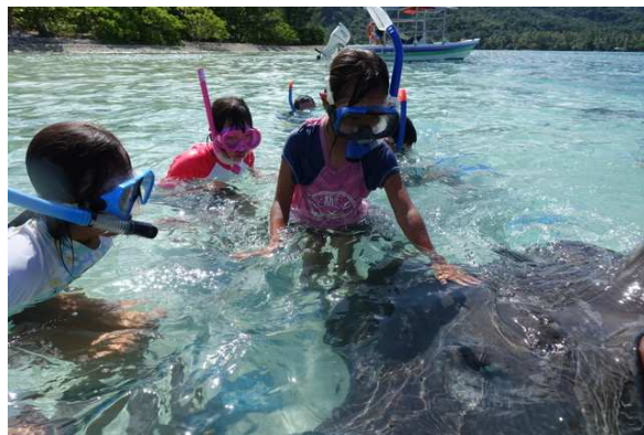
** エイとの触れ合い