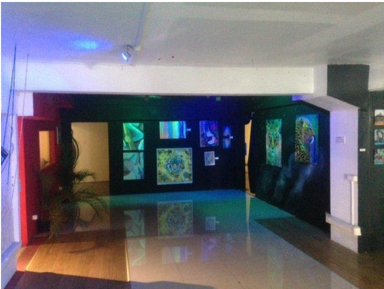
こちらは館内入口

2016年にオープンしたこちらのミュージアムは8部屋に分かれ、それぞれの壁にアーティストの作品を見ることが出来ました。